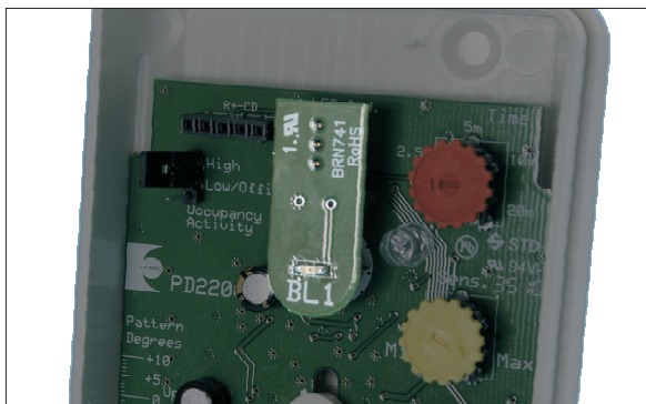
Fältindikator BL-1 Lysdiod

Är detektorn strömförsörd lyser lysdioden och utgör en punktformig ljuskälla i fokus av linssystemet. Sätt tillbaka frontkåpan.