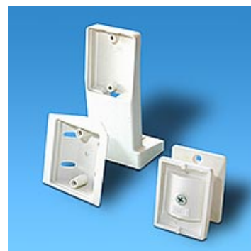
Universalfäste BR-1 & BR-2

OBS! Om universalfästen skall användas, kontakta först Extronic för rådgivning!