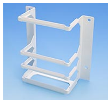
Skyddsgaller - 13038